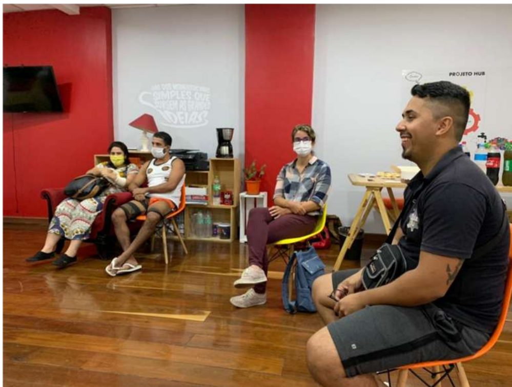
Feb 2021 -Meeting entre super mentores e participantes

O suporte contínuo nos negócios tem como objetivo colocar à disposição dos jovens que participaram do projeto a mentoria com empreendedores com mais experiência e relativo sucesso em seus negócios.