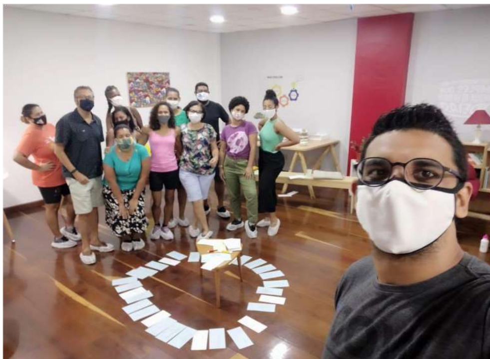
Foto do primeiro Pizza Hub presencial da turma 02.

O Pizza hub é uma ação atrelada à mentoria individual. Uma vez por mês o grupo de jovens empreendedores se encontra para estreitar laços de amizade, compartilhar sucessos e frustrações em seus empreendimentos. Também é um espaço formativo com palestras e atividades que podem agregar ainda mais habilidades aos participantes. Com o agravamento da transmissão da Covid-19, a ação vem ocorrendo online.