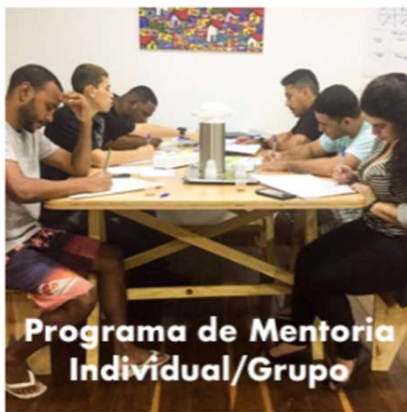
Individual/Group Mentoring Programme