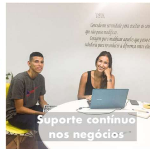
On-going business Support